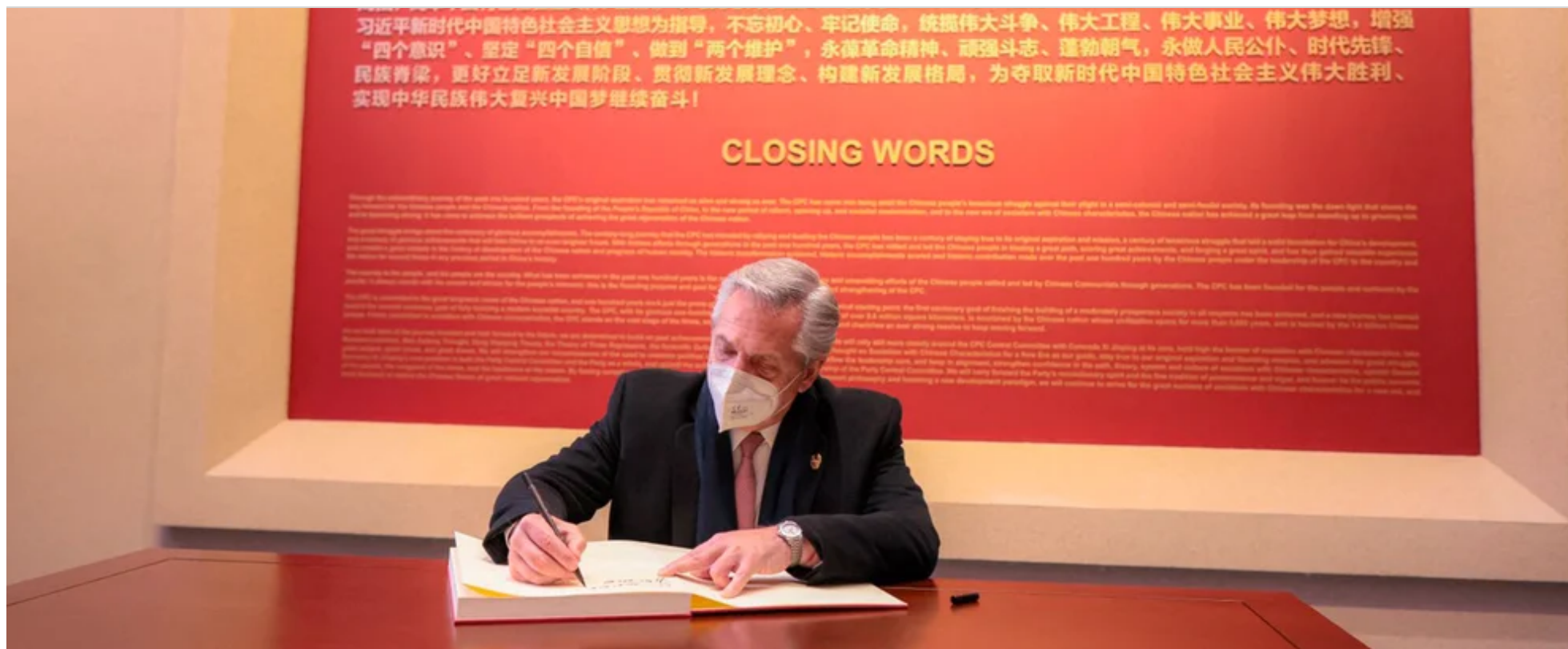
La "sustancia" del viaje tuvo lugar durante su reunión con el presidente Xi el último día

La colaboración en materia de minería mencionada en el comunicado probablemente incluya el plan recientemente anunciado por la empresa Zijin, con sede en la República Popular China, de construir una planta de carbonato de litio en la provincia de Catang por valor de 38