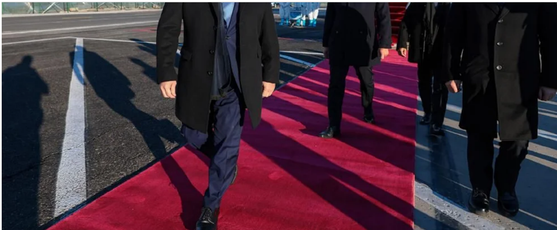
Alberto Fernández en China

En Rusia, en su encuentro público con Putin, en comentarios que diferían de lo que el Ministerio de Asuntos Exteriores había preparado para él, Fernández eliminó cualquier duda sobre sus sentimientos personales y el propósito de su visita. En un momento de proclamar su deseo de utilizar el Fondo Monetario Internacional, con su presencia directa en América Latina, directamente a