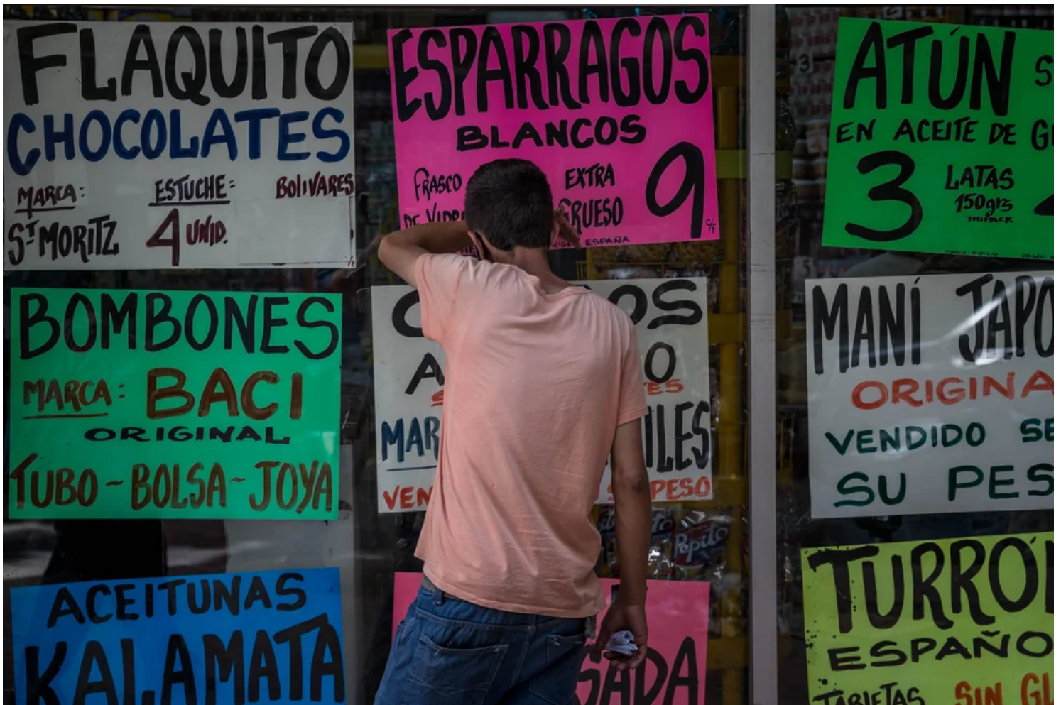
Los efectos inflacionarios de la invasión rusa a Ucrania agravaron las tensiones (Un hombre observa precios en Venezuela/EFE/Miguel Gutiérrez/Archivo)

Los efectos inflacionarios de la invasión rusa a Ucrania agravaron estas tensiones , golpeando a las poblaciones vulnerables con aumentos significativos en los costos de las necesidades como alimentos y combustible para el transporte, para la calefacción y para cocinar, provocando protestas desde Perú hasta Ecuador , Panamá y Guatemala .